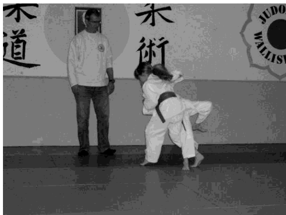
O-Soto-Gari, ein sehr beliebter Wurf